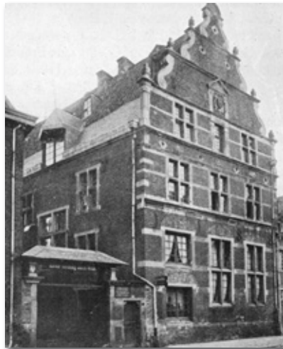
Der prächtige Renaissancebau des Kornhauses bot dem ersten Dürener „Heimatmuseum“ ein Domizil

Seit 1938 besaß die Stadt sogar im prächtigen Renaissancegebäude des „Kornhauses“ ein eigenes Heimatmuseum, das allerdings wie die gesamte Alt-