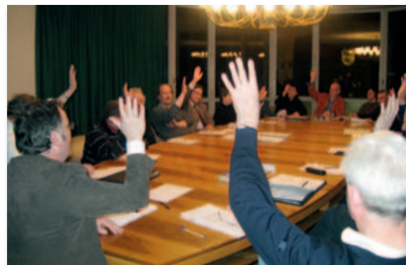
Gründung des „Trägervereins Stadtmuseum Düren e.V.“ am 18. März 2009 im Kleinen Sitzungssaal des Dürener Rathauses.