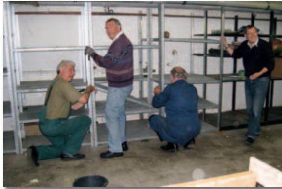
Aus dem Lager eines aufgegebenen Geschäftes wurden die ersten Regale besorgt.

neten Räumlichkeiten beantwortete die Sparkasse Düren, indem sie eine leer stehende ehemalige Sparkassenfiliale zur Verfügung stellte. Auf dieser Basis machte die Gründung eines Trägervereins im März 2009 richtig Sinn, der kurze Zeit später mit ersten Arbeiten in den Räumlichkeiten beginnen konnte.