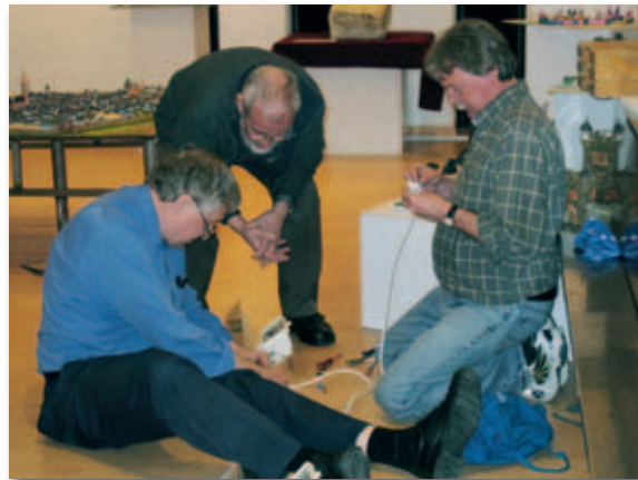
Viele Hände waren bei den vorbereitenden Arbeiten zum Aufbau der Ausstellung beteiligt.

So ist der erste Abschnitt der Ständigen Ausstellung geprägt durch viel Improvisation und Anleihen bei anderen Instituten und Museen. Aus inhaltlichen, aber auch aus Platzgründen sollte er eine schlaglichtartige Darstellung zentraler Stationen Dürener Stadtgeschichte bis zum Ende der Franzosenzeit bieten. Schautafeln, Pläne, Urkunden, Gedenk- und