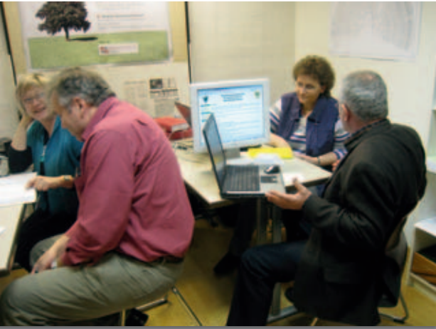
Intensiv wahrgenommen wird die Beratung in allen Fragen der Familienforschung durch die Dürener Genealogen der WGfF

„Dürener Zeitung“ – sie alle lassen sich gerne in aller Ruhe die einzelnen Epochen der Stadtgeschichte erläutern, informieren sich über die Entstehung des Stadtmuseums und werfen einen Blick hinter die Kulissen, ins Magazin, die Werkstatt und das Archiv. Nicht selten wird anschließend im gemütlichen Arbeitsbereich des Museums bei einer Tasse Kaffee noch intensiv gefachsimpelt.