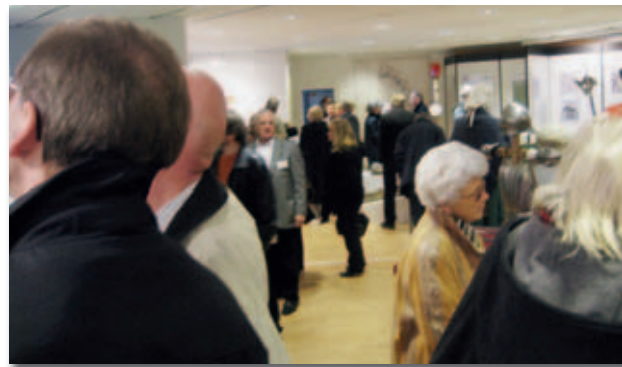
„Die Dürener stürmten ihr Stadtmuseum“ schrieb die Presse – völlig zu Recht ...

Dieser erste Teil der Ständigen Ausstellung wurde am 29. November 2009 – also ein gutes halbes Jahr nach Gründung des Trägervereins – der Öffentlichkeit vorgestellt. Mehr als 500 Besucher an diesem ersten „Schnuppertag“ waren der Lohn für viele Wochen intensiver Arbeit.