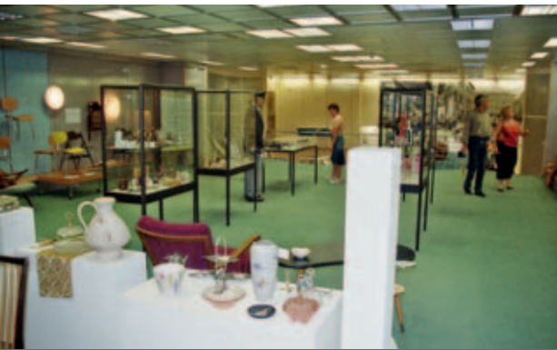
Initialzündung zur Realisierung des Stadtmuseums bot die Ausstellung „Leben, Wohnen, Arbeiten in den 50ern“ im ehemaligen Bettenhaus Thiemonds, die in sieben Wochen mehr als 10.000 Besucher anzog.

stadt in jenen Jahren wieder aufgebaut worden sind und man sich dieses Erbes stärker bewusst werden wollte. Zu den zahlreichen Programmpunkten trug die Dürener Geschichtswerkstatt mit einer Ausstellung „Leben, Wohnen, Arbeiten in den 50ern“ bei, die, aufgebaut im ehemaligen „Bettenhaus Thiemonds“, das den authentischen Geist jener Zeit atmete, mit über 10.000 Besuchern ein großes Echo fand und von der Bevölkerung sehr positiv aufgenommen wurde.