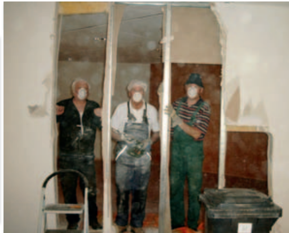
Auch das Entfernen einer Zwischenwand stellt für die Mannschaft kein wirkliches Problem dar.

Von nun an galt es für die Aktiven, an einer Vielzahl von „Fronten“ gleichzeitig zu kämpfen. Neben den langwierigen vereinsrechtlichen Formalien